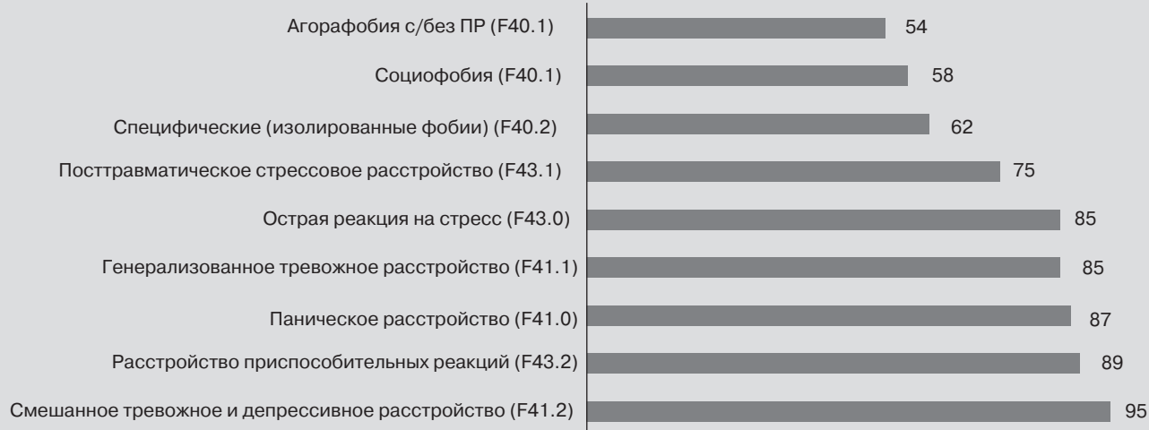
Рисунок 1. Доля (%) респондентов-психиатров ( n = 960 ), которые выставляли соответствующие диагнозы из группы тревожных, связанных со стрессом расстройств и смешанного тревожного и депрессивного расстройства хотя бы один раз в течение года, предшествовавшего опросу

Для оценки полученных результатов было проведено сопоставление ответов участников опроса РОП