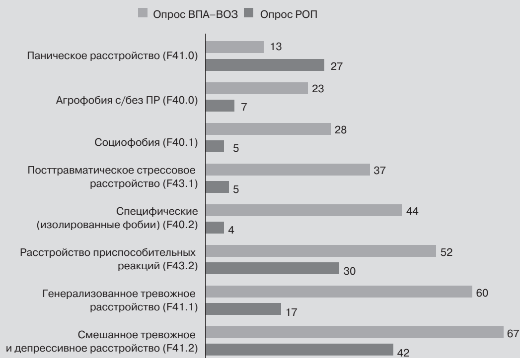
Рисунок 3. Доля психиатров (%), участвовавших в опросах ВПА-ВОЗ ( n = 4887 ) [4] и РОП ( n = 960 ), отметивших, что они используют соответствующие диагнозы тревожных, связанных со стрессом расстройств и смешанного тревожного и депрессивного расстройства как минимум 1 раз в неделю в своей повседневной клинической практике (диагноз «острая реакция на стресс» отсутствовал в перечне диагностических рубрик опроса ВПА-ВОЗ, в связи с чем он был исключен из сравнения)