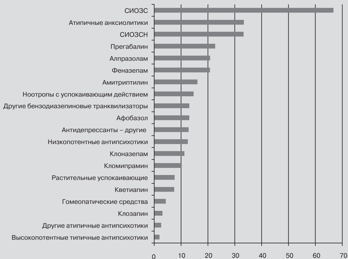
Рисунок 5. Доля респондентов (%), указавших, что они назначают соответствующие препараты / группы препаратов в качестве первой линии терапии при лечении тревожных расстройств

15 % респондентов (140 человек), осуществляющих диагностику в рамках своей повседневной работы, отметили, что ни разу не использовали диагноз ГТР за прошедший год, при этом большая часть из них (84 %) не встречали больных с соответствующей симптоматикой в своей практике (среди этих респондентов почти половина были работниками психиатрических стационаров), а остальные (16 %) отметили, что не ставят диагноз ГТР, поскольку недостаточно знакомы с диагностическими критериями или для соответствующих критериям больных предпочитают использовать другие диагнозы (в комментариях эти респонденты отмечали, например, что «данный диагноз не является нозологией. Тревога – даже не синдром, это симптом», или что «диагноз ГТР для меня не объясняет этиопатогенетические механизмы возникновения тревожного расстройства», «...не позволяет выстроить и понять “модель” психического расстройства у данного пациента и механизмы его формирования»). Выбор лекарственных препаратов для терапии группы тревожных и связанных со страхом расстройств (ГТР, ПР, агорафобия, социофобия, специфические фобии) участниками опроса в целом во многом совпадает с существующими международными и отечественными клиническими рекомендациями [6, 7]. На рис. 5 приведены доли респондентов, выбравших те или иные группы препаратов в качестве первой линии терапии при данных расстройствах. Две трети респонден-